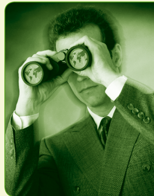
Nach der definitiven Migration in Horw: "Tatsächlich..., alle Daten noch da!"

Das Berechtigungskonzept wurde vom Datenschutzbeauftragten genehmigt. Die Berechtigungen sind so gestaltet, dass alle Systemnutzer und -nutzerinnen die für ihre Aufgabenerfüllung notwendigen Lese- und Mutationsrechte erhalten. Soweit bezüglich einer steuerpflichtigen Person in einer Gemeinde kein steuerlicher Anknüpfungspunkt besteht, sind die Berechtigungen auf das Leserecht für die Personendaten beschränkt. Diese Regelung stellt den