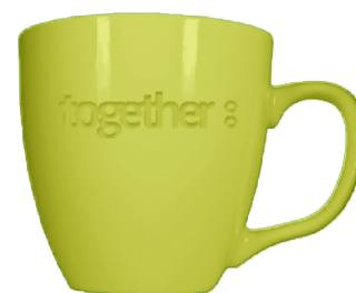
together: Tasse mit Kult-Status

Together ist abgeschlossen. Alle wesentlichen Projektziele wurden erreicht. Durch die beschlossenen Neuerungen wird heute die Qualitätssicherung durch die Gemeindesteuerämter sowie die Aufsichtsfunktion der Dienststelle Steuern professioneller wahrgenommen. Und, besonders erfreulich, die Steuerfachleute der Gemeinden und die Mitarbeitenden der Dienststelle Steuern arbeiten heute partnerschaftlicher und auf gleicher Augenhöhe zusammen. In diesem Sinne beinhaltet together nicht nur eine Qualitäts- und Prozessoptimierung sondern trug wesentlich zu einer nachhaltigen Kulturveränderung zwischen der Dienststelle Steuern und den Gemeindesteuerämtern bei. Dies bewog denn auch Felix Muff, sich als Leiter der Dienststelle und als Projektauftraggeber bei allen am Projekt Beteiligten mit einer attraktiv gestalteten together-Tasse für den grossen Einsatz zu bedanken. Auf ein weiteres, erfolgreiches Together!