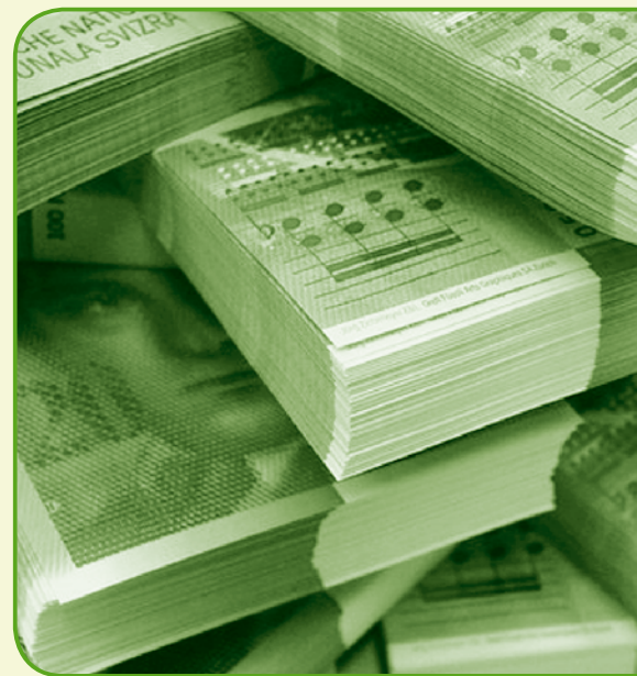
Verlustscheine sind in Archiven schlummerndes, bares Geld

Im Rahmen des im Aufbau begriffenen Bezugskompetenz-Centers zu Gunsten der Gemeinden wird die Dienststelle Steuern, Abteilung Bezug und Quellensteuer, den Gemeinden die Verlustscheinbewirtschaftung zu konkurrenzfähigen Konditionen anbieten. Die Abteilung betreibt seit dem Jahr