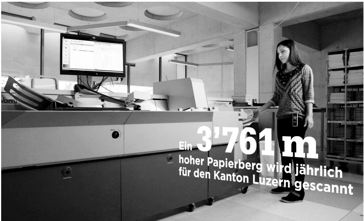
Scanning der Luzerner Steuererklärungen im Scan Center des Steueramtes der Stadt Zürich.

Kanton über die Schweizerische Post einheitlich und kostenoptimiert sicher.