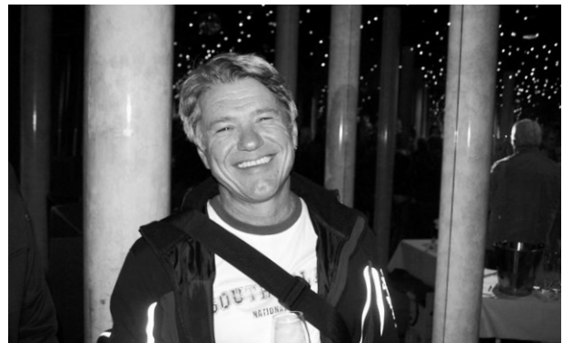
Foxtrail, Spiegelsaal sowie köstliche kulinarische Momente zum Abschluss ...

Kantonen und dem Bund, Fristverlängerungsgesuche, Abfragen der Steuerkontos, elektronische Rechnungen und die Internetsteuererklärung.